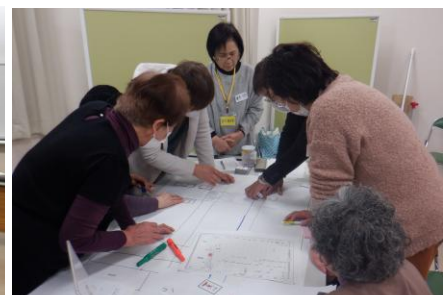
避難所運営ゲームHUG