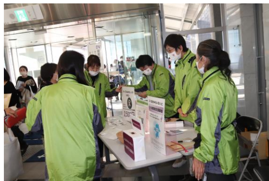
あすばるフォーラム2022での DV被害者支援品販売の様子