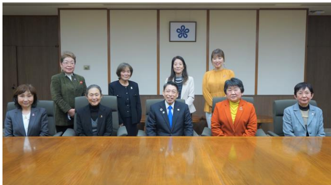
知事との意見交換会